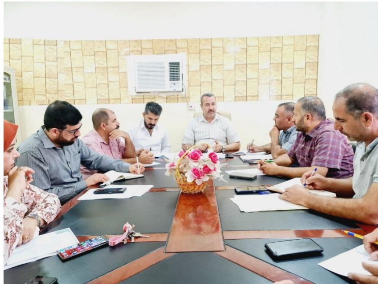
مجلس كلية الطب البيطري / جامعة تكريت / 2023-2024

إن مجلس الكلية يقوم على مبدأ التفاعل، ولهذا فإن الواجبات التي يقوم بها عديدة منها: • الاطلاع على التعليمات الصادرة من الوزارة ورئاسة الجامعة وتنفيذها . • إصدار الأوامر الإدارية المتعلقة بهيكلية الكلية من أجل تحديد حقوق الموظفين وواجباتهم . • الرقابة الفعلية والكاملة لموازنة الكلية المالية وتحديد أبواب الصرف حسب الصلاحيات الممنوحة له. • التفاعل الكامل بين إدارة الكلية وأقسامها وشعبها ووحداتها . • مناقشة الأمور المتعلقة بالتدريسيين والموظفين والطلبة وإيجاد الحلول المناسبة لها . • رفع توصيات بالأمور التي تحتاج إلى مصادقة رئاسة الجامعة ، وتمشية الأمور المتعلقة بها من خلال إصدار أوامر إدارية.